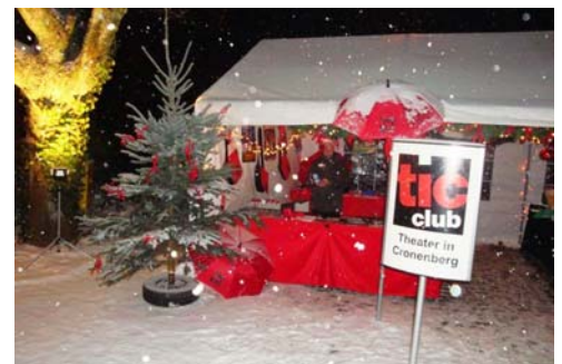
Der festlich geschmückte Informations- und Verkaufsstand des TiC Club

Mehr unter: http://www.tic-theater.de/article25041-49.html