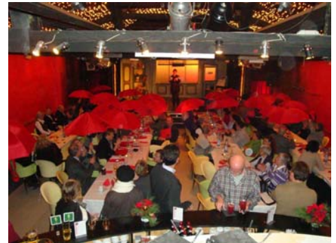
Der neue feuerrote TiC Regenschirm. Unverkennbar ein begehrter Artikel.

Mehr unter: http://www.tic-theater.de/article25040-49.html