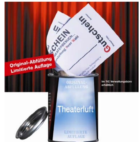
Die Theaterluftdose – exklusiv für Mitglieder des TiC Club e.V.

Erhältlich sind die Dosen in der TiC Verwaltung in der Borner Straße. Bitte unbedingt beachten: Geben Sie beim Kauf an, dass Sie Mitglied im TiC Club sind.