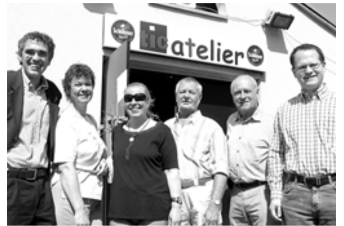
Grund zur Freude: Der Vorstand des TiC Club e.V. nach der Mitgliederversammlung

Mit einer Mitgliedschaft im TiC Club e.V. können auch Sie schon mit einem kleinen Jahresbeitrag einen großen Beitrag zur Förderung des TiC-Theaters leisten, dabei von den Vorteilen einer Mitgliedschaft profitieren und aktiv mithelfen, eine so einmalige Kulturinstitution wie das TiC-Theater nachhaltig zu unterstützen.